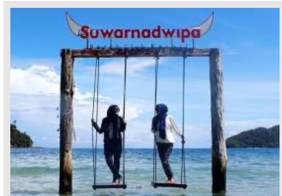
Gambar 4. Ide spot foto di pantai

Saat ini telah tersedia beberapa spot foto yang menarik seperti Warung Zainab yang ditampilkan pada film Impian Seribu Pulau. Selain Warung Zainab, tempat penanaman mangrove juga dilengkapi dengan sebuah restoran terapung. Sangat penting bagi wisatawan untuk mengambil foto yang instagrammable. Bila pulau ini menyediakan spot tersebut, maka jelas akan menjadi daya Tarik wisata.