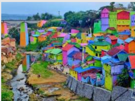
Gambar 1. Ide rumah warna-warni di Malang

Ide warna-warni yang berseri ini terinspirasi dari beberapa tujuan pariwisata yang telah ada dan menjadi viral karena daya Tarik keunikannya, seperti rumah warna warni di Malang (Lihat gambar 1)