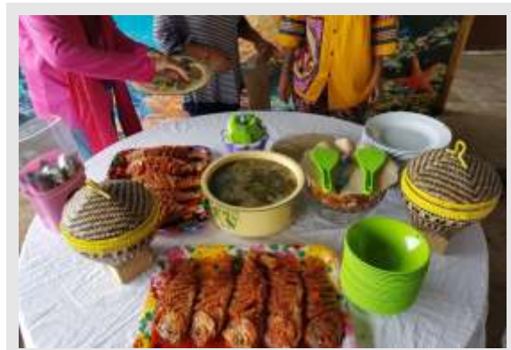
Gambar 2. Menu Makan Siang di Kelapa Dua Saat Ini

Untuk dapat memberikan kepuasan pelayanan pada wisatawan maka hal yang penting adalah pada penyajian makanan yang memberikan kesan istimewa. Untuk mencapai hal ini diperlukan pendampingan dari restoran dan ahli tata boga, agar penduduk dapat menguasai ketrampilan seni boga dan juga cara penyajiannya, meskipun tetap harus bernuansa Bugis.