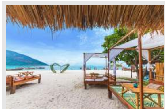
Gambar 3. Usulan ide restaurant di pinggir pantai