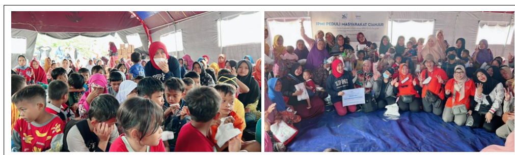
Pemberian Spiritual Healing bagi Anak-anak Terdampak Gempa, Desa Gasol, Kecamatan Cugenang, Kabupaten Cianjur 13 Desember 2022