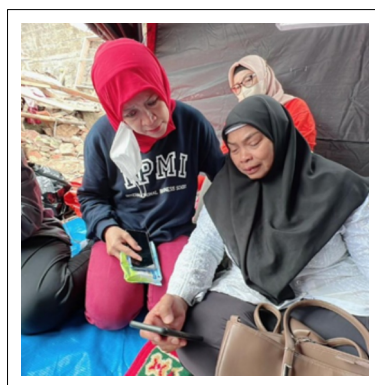
Pelaksanaan Spiritual Healing bagi Masyarakat Terdampak Bencana Gempa, Desa Gasol, Kecamatan Cugenang, Kabupaten Cianjur 13 Desember 2022